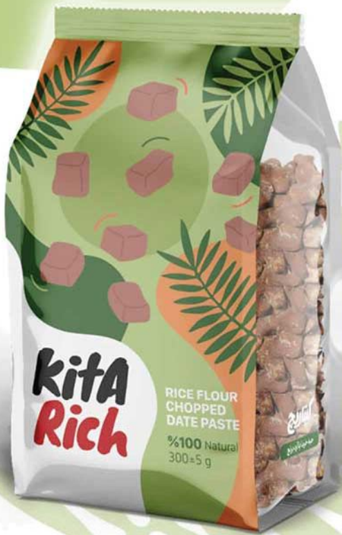
کیتاریچ حبه خرما با آرد برنج Kita Rich Rice Flour Chopped Date Paste

✱ حاوی خمیر خرما، پودر کاکائو، آرد برنج و طعم دهنده مشابه طبیعی شکلات