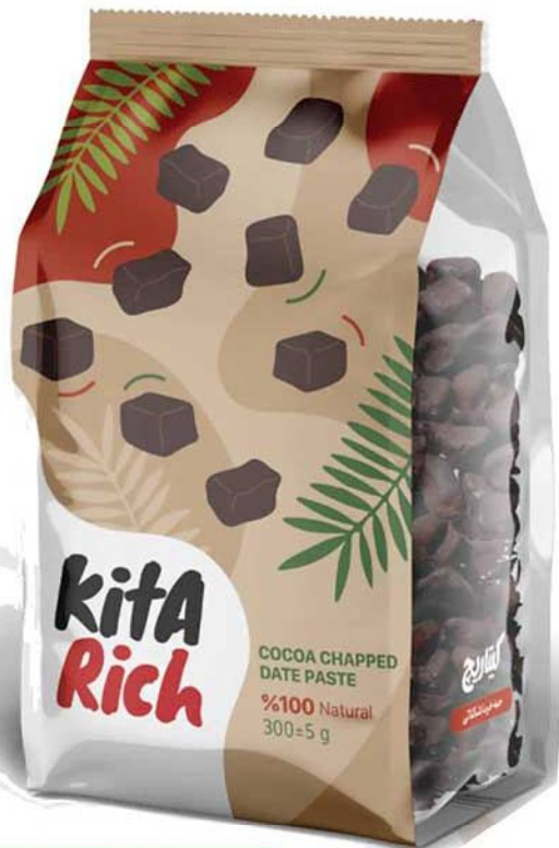
کیتاریچ حبه خرما شکلاتی Kita Rich Cocoa Chopped Date Paste